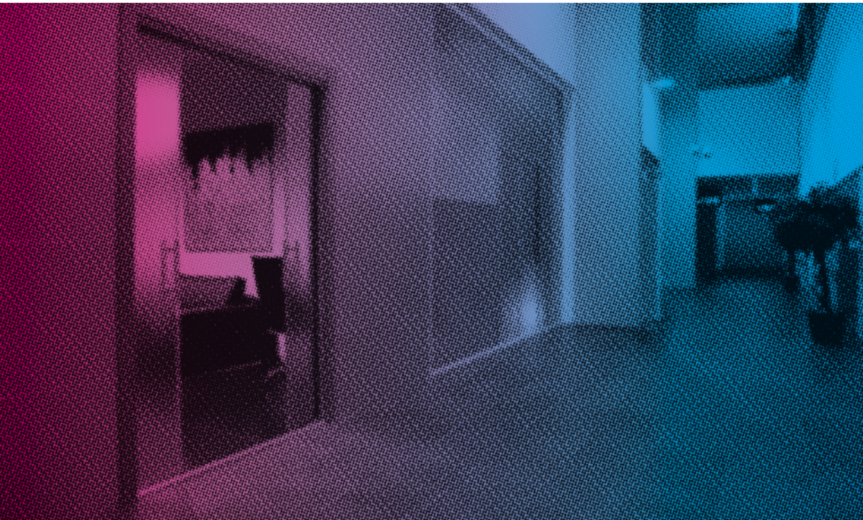
Eclisse MOTORIZZATO > Barceairport Terminal C ↑ ↑↑

Arch. > Ricardo Bofill Barcelona - Spain